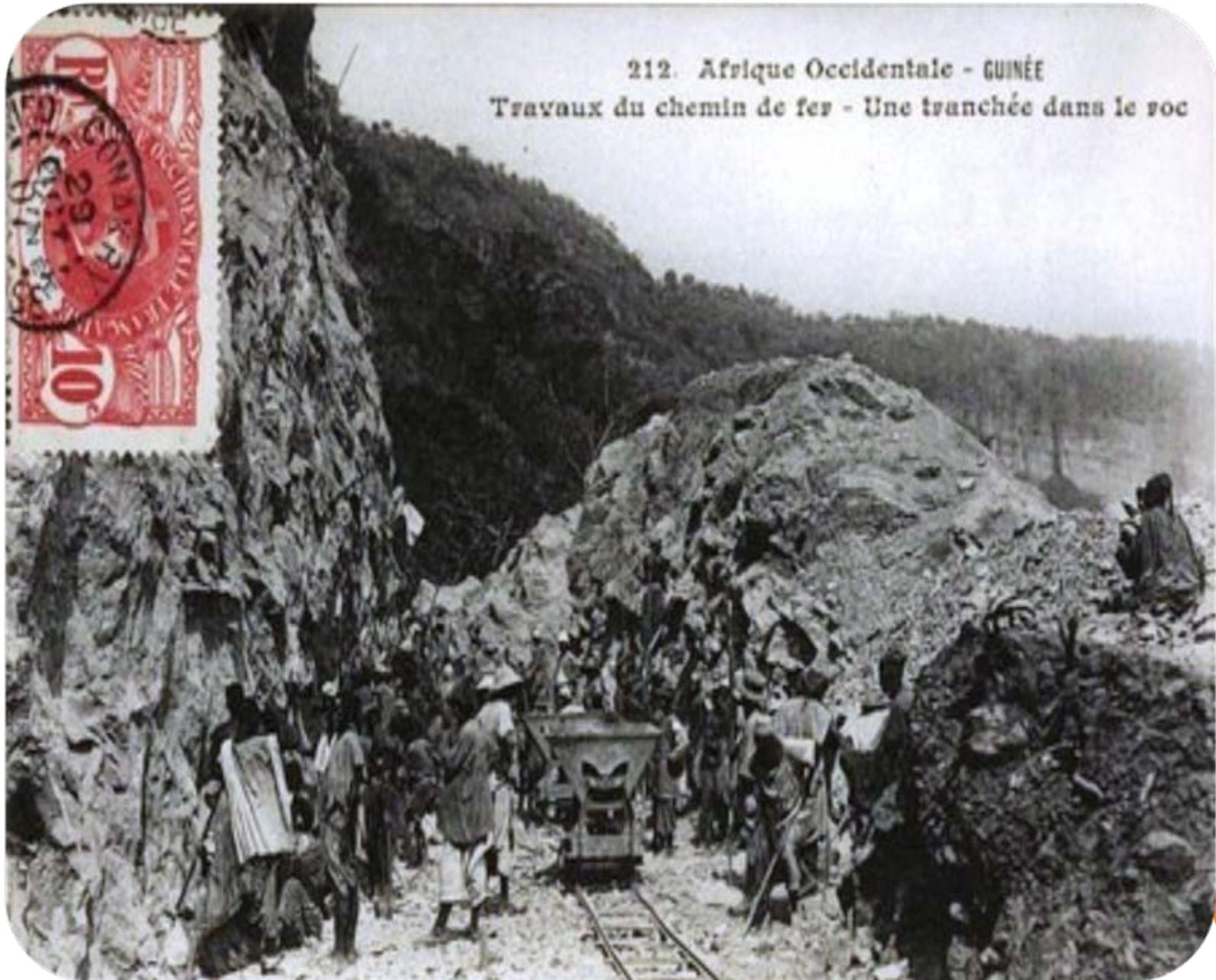
212. Afrique Occidentale - GUINÉE Travaux du chemin de fer - Une tranchée dans le roc